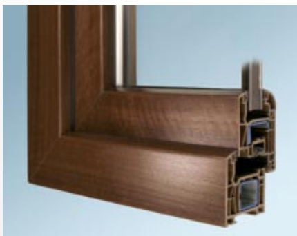
Laminácia Siena noce