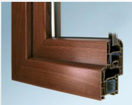
Laminácia Siena rosso